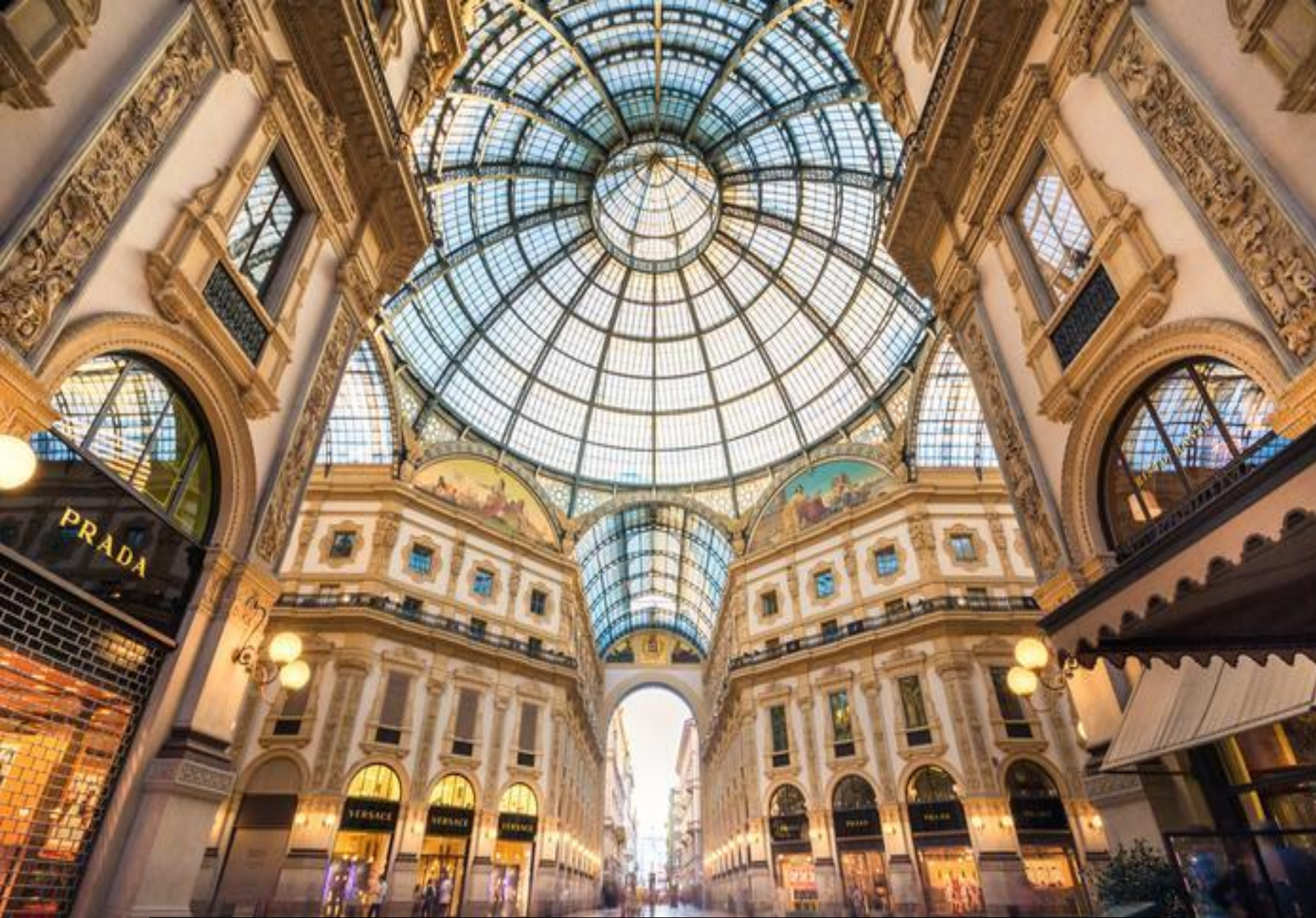
Galleria Wiktora Emanuela II w Mediolanie